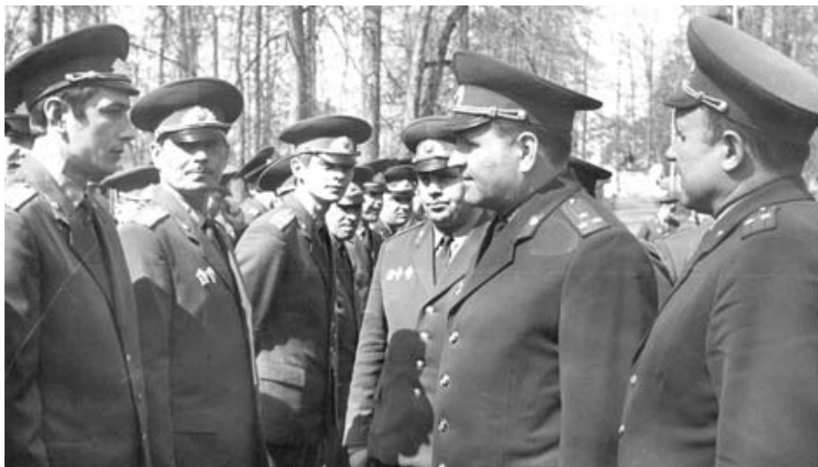
Ежегодный смотр личного состава